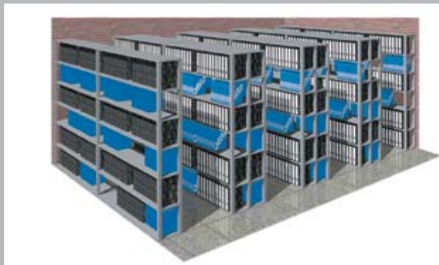
Estantería / Shelving units / Rayonnage

capacity comparison chart / comparaison de capacités